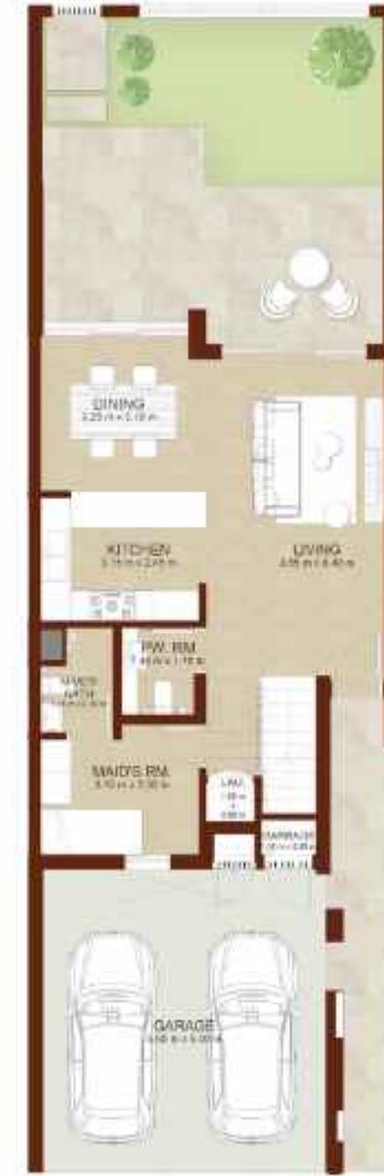
GROUND LEVEL الطابق الارضي

Note: Plan and details included are indicative only and are subject to change by the Master Developer/Seller at its sole discretion without notice and/or liability. All images, including features, finishes, furnishings and scale are illustrative only. Final areas, dimensions, layout and materials may differ from those stated, and the layout may be mirrored. The plot area shown is illustrative only and the actual plot area may vary depending on the plot location in the Master Community as selected by the purchaser.