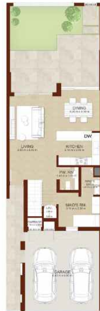
GROUND LEVEL الطابق الارضي

Note: Plan and details included are indicative only and are subject to change by the Master Developer/Seller at its sole discretion without notice and/or liability. All images, including features, finishes, furnishings and scale are illustrative only. Final areas, dimensions, layout and materials may differ from those stated, and the layout may be mirrored. The plot area shown is illustrative only and the actual plot area may vary depending on the plot location in the Master Community as selected by the purchaser.