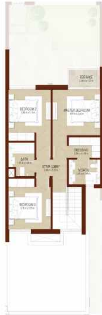
FIRST LEVEL الطابق الاول