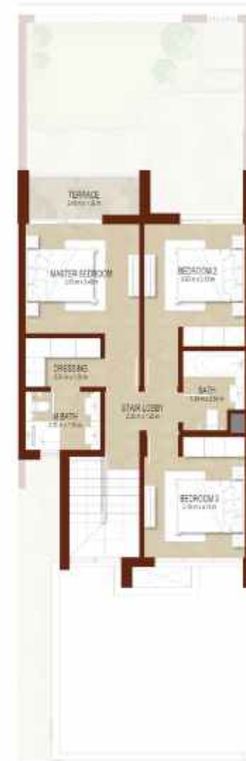
FIRST LEVEL الطابق الاول