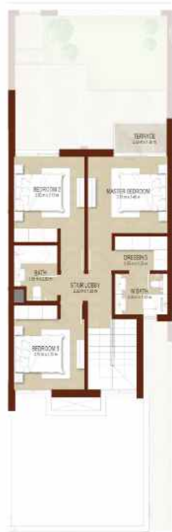
FIRST LEVEL الطابق الاول