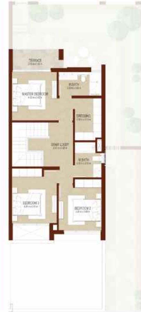
FIRST LEVEL الطابق الاول

4 غرف نوم تاون هاوس - الوحدة 4E-1 4-BEDROOM TOWNHOUSE-TYPE 4E-1