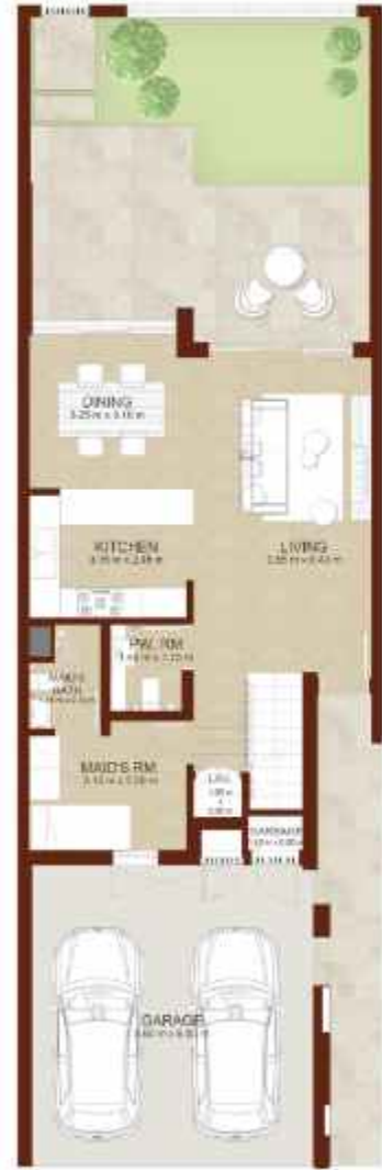
GROUND LEVEL الطابق الارضي