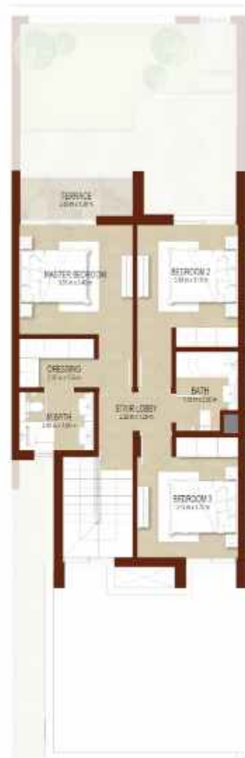
FIRST LEVEL الطابق الاول