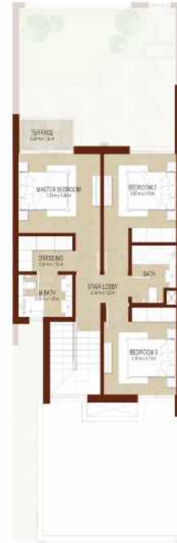
FIRST LEVEL الطابق الاول