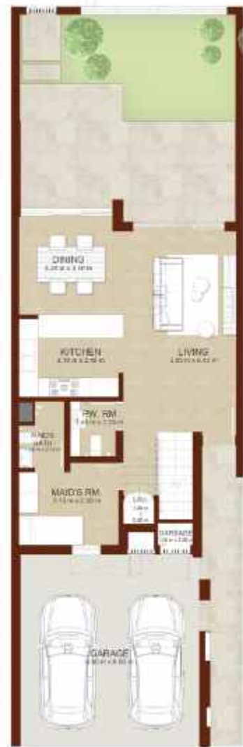
GROUND LEVEL الطابق الارضي