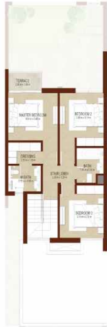
FIRST LEVEL الطابق الاول