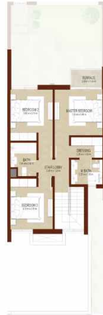
FIRST LEVEL الطابق الاول