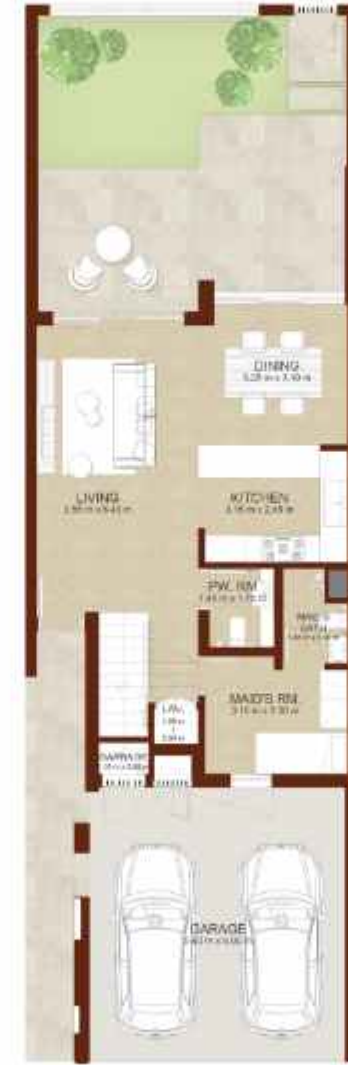
GROUND LEVEL الطابق الارضي

Note: Plan and details included are indicative only and are subject to change by the Master Developer/Seller at its sole discretion without notice and/or liability. All images, including features, finishes, furnishings and scale are illustrative only. Final areas, dimensions, layout and materials may differ from those stated, and the layout may be mirrored. The plot area shown is illustrative only and the actual plot area may vary depending on the plot location in the Master Community as selected by the purchaser.