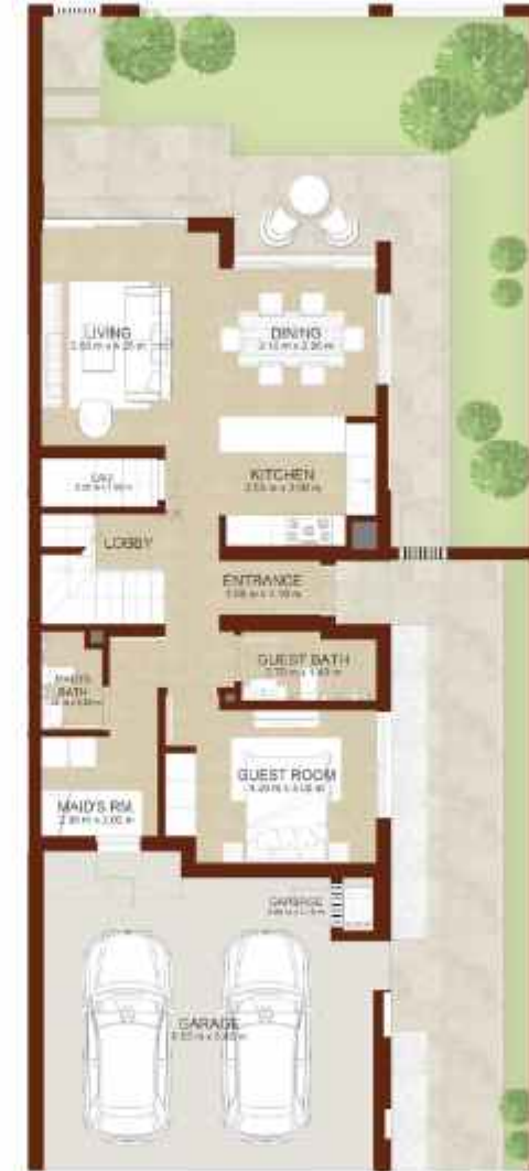
GROUND LEVEL الطابق الارضي

Note: Plan and details included are indicative only and are subject to change by the Master Developer/Seller at its sole discretion without notice and/or liability. All images, including features, finishes, furnishings and scale are illustrative only. Final areas, dimensions, layout and materials may differ from those stated, and the layout may be mirrored. The plot area shown is illustrative only and the actual plot area may vary depending on the plot location in the Master Community as selected by the purchaser.