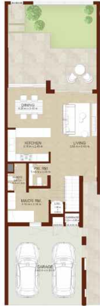
GROUND LEVEL الطابق الارضي