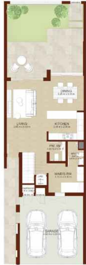
GROUND LEVEL الطابق الارضي