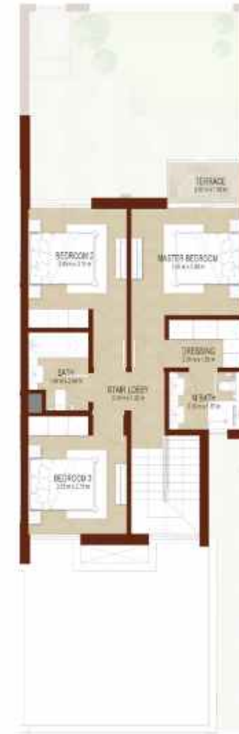
FIRST LEVEL الطابق الاول