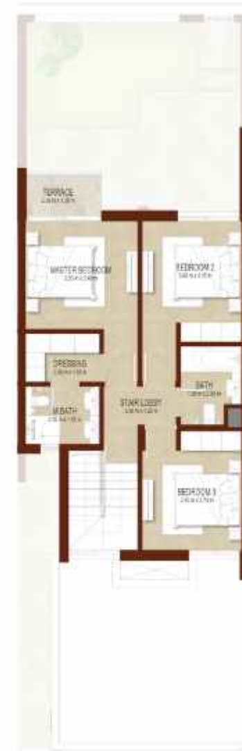
FIRST LEVEL الطابق الاول