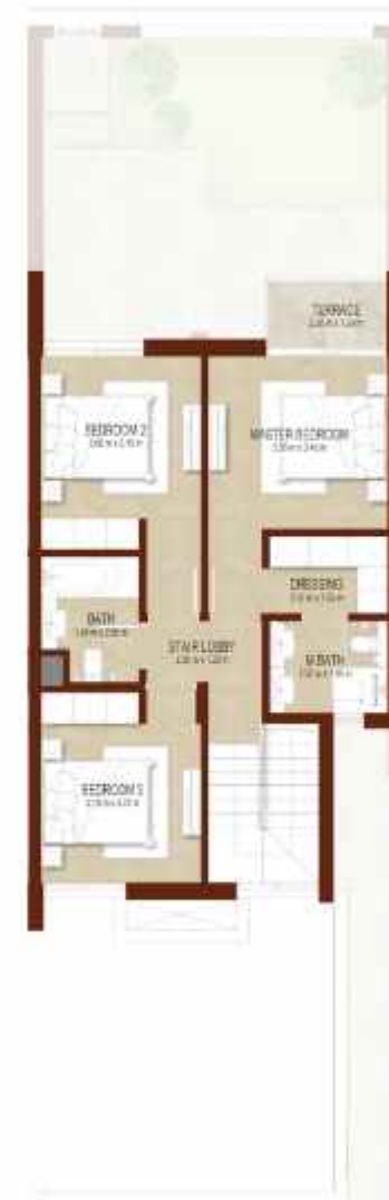
FIRST LEVEL الطابق الاول