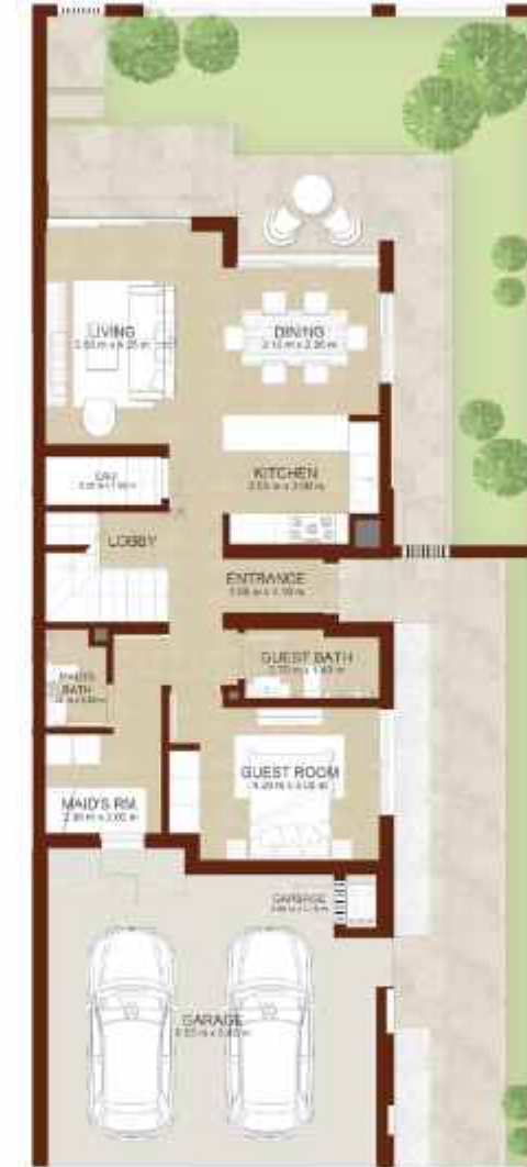
GROUND LEVEL الطابق الارضي

Note: Plan and details included are indicative only and are subject to change by the Master Developer/Seller at its sole discretion without notice and/or liability. All images, including features, finishes, furnishings and scale are illustrative only. Final areas, dimensions, layout and materials may differ from those stated, and the layout may be mirrored. The plot area shown is illustrative only and the actual plot area may vary depending on the plot location in the Master Community as selected by the purchaser.