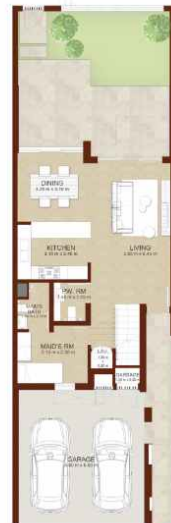
GROUND LEVEL الطابق الارضي

Note: Plan and details included are indicative only and are subject to change by the Master Developer/Seller at its sole discretion without notice and/or liability. All images, including features, finishes, furnishings and scale are illustrative only. Final areas, dimensions, layout and materials may differ from those stated, and the layout may be mirrored. The plot area shown is illustrative only and the actual plot area may vary depending on the plot location in the Master Community as selected by the purchaser.