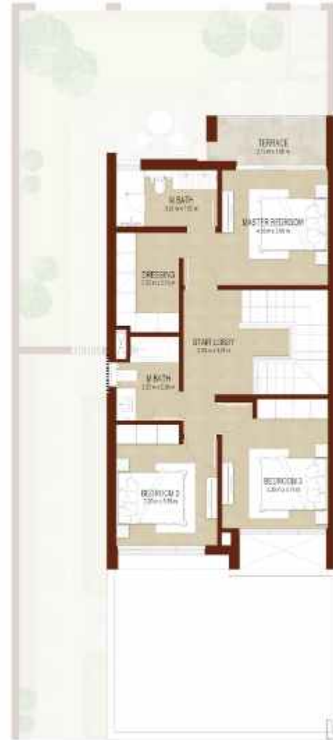
FIRST LEVEL الطابق الاول

4 غرف نوم تاون هاوس - الوحدة 4E-1(M) 4-BEDROOM TOWNHOUSE-TYPE 4E-1(M)