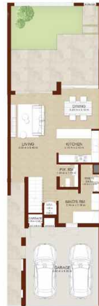
GROUND LEVEL الطابق الارضي

Note: Plan and details included are indicative only and are subject to change by the Master Developer/Seller at its sole discretion without notice and/or liability. All images, including features, finishes, furnishings and scale are illustrative only. Final areas, dimensions, layout and materials may differ from those stated, and the layout may be mirrored. The plot area shown is illustrative only and the actual plot area may vary depending on the plot location in the Master Community as selected by the purchaser.