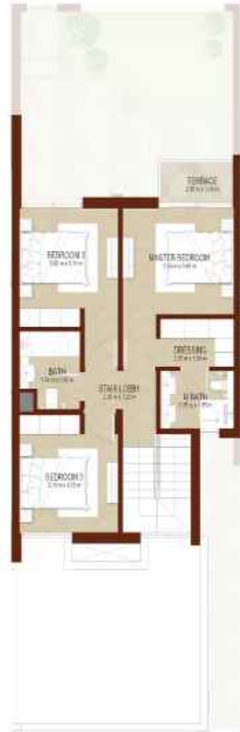
FIRST LEVEL الطابق الاول