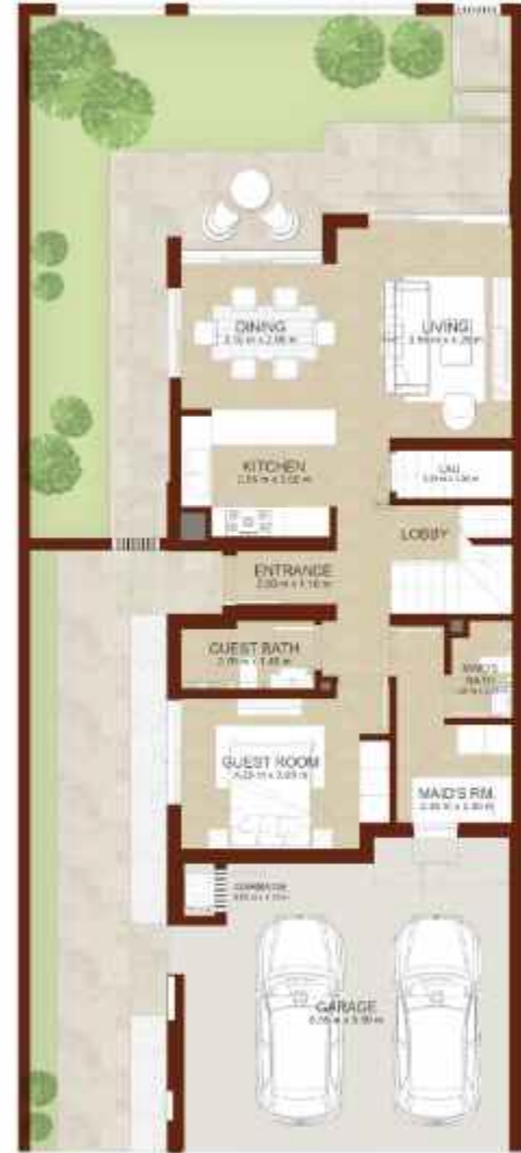
GROUND LEVEL الطابق الارضي