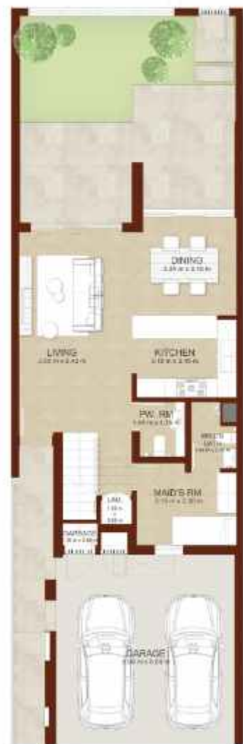
GROUND LEVEL الطابق الارضي