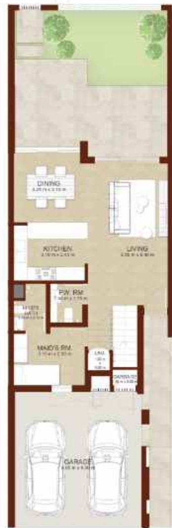
GROUND LEVEL الطابق الارضي